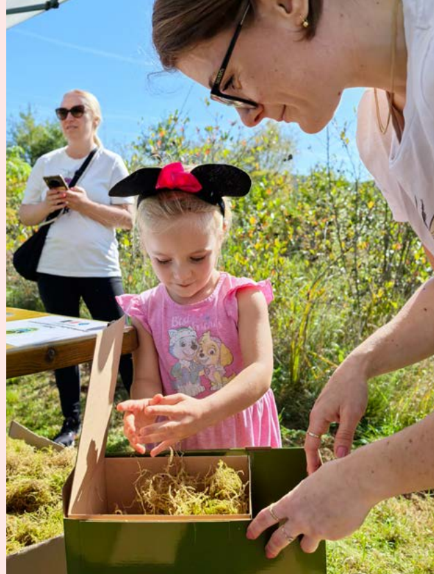
Izdelovanje gnezdilnic za čmrlje na Vodomčevem festivalu.