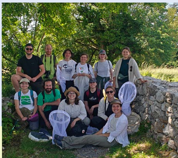
Usposabljanje za določanje čebel samotark za udeležence iz Slovenije in Hrvaške.