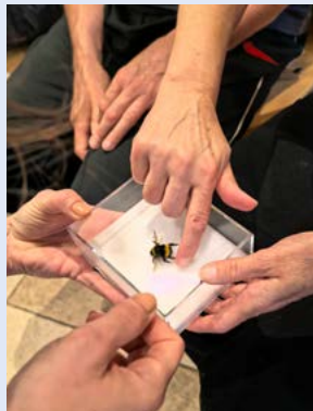
Delavnica na taboru slepih v Podcerkvi v Loški dolini.