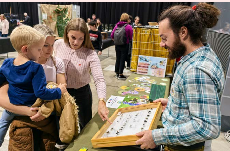
Na štiridnevni stojnici na razstavi eksotičnih živali Bioexo so se zvrstili številni obiskovalci.