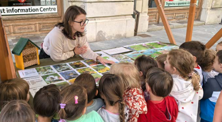
Stojnica v Ljubljani ob svetovnem dnevu čebel.