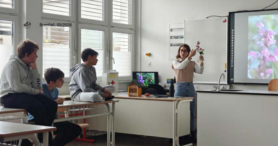
Predavanje ob dnevu slovenske hrane na Osnovni šoli Simona Jenka Smlednik.