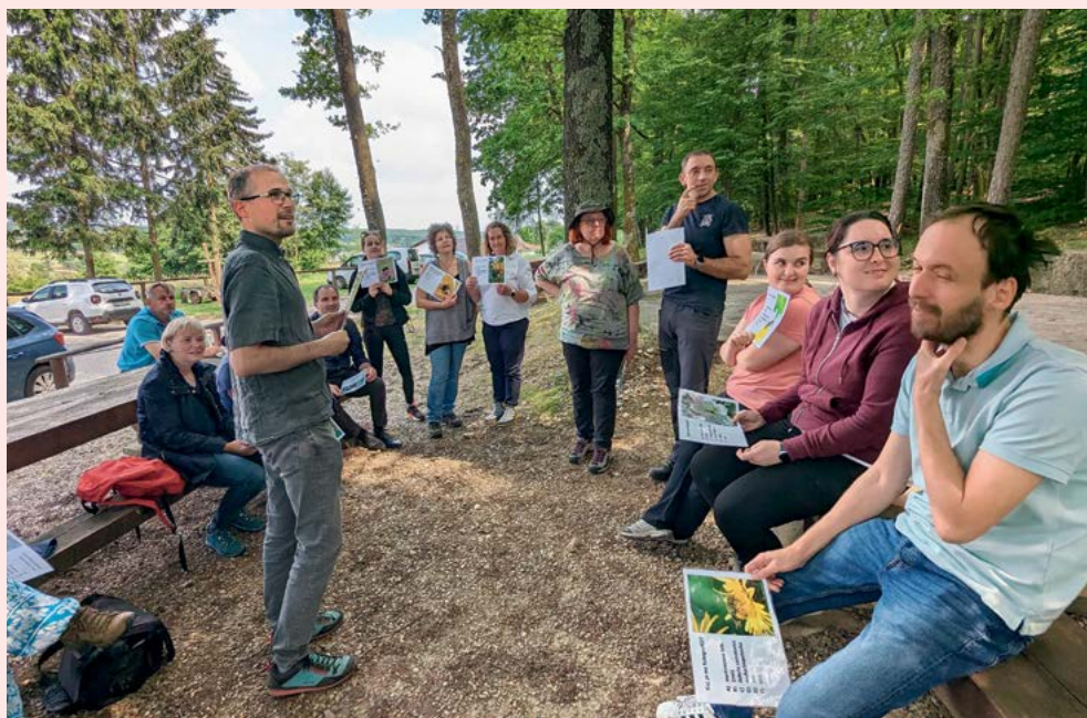
Terensko usposabljanje kmetijskih svetovalcev v Krajinškem parku Goričko.