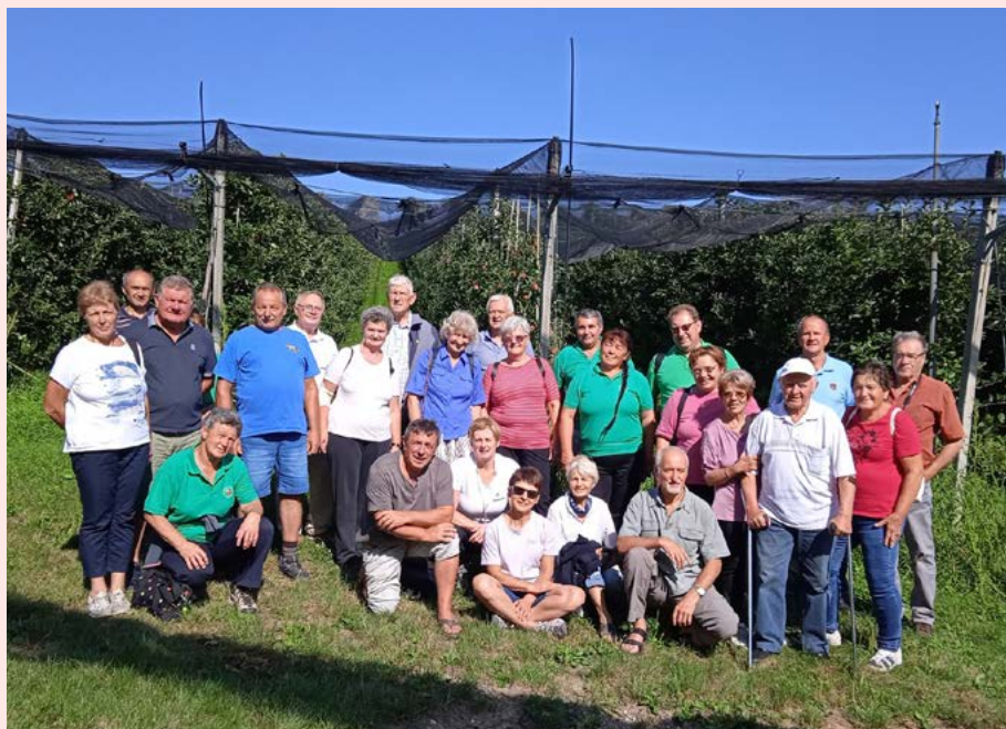
Udeleženci predavanja v Sadjarskem centru Maribor.

V organizaciji Biotehniške fakultete Univerze v Ljubljani smo sodelovali na dveh terenskih usposabljanjih kmetijskih svetovalcev. Prvo je bilo v Krajinškem parku Šturmovci, drugo pa v Krajinškem parku Goričko. Izvedli smo tudi dve predavanji, in sicer v Grobljah in na Ptuju. V organizaciji Kmetijsko gozdarskega zavoda Maribor pa smo izvedli tri predavanja za kmete, in sicer v Sadjarskem centru Maribor, v Mariboru in Prožinski vasi.