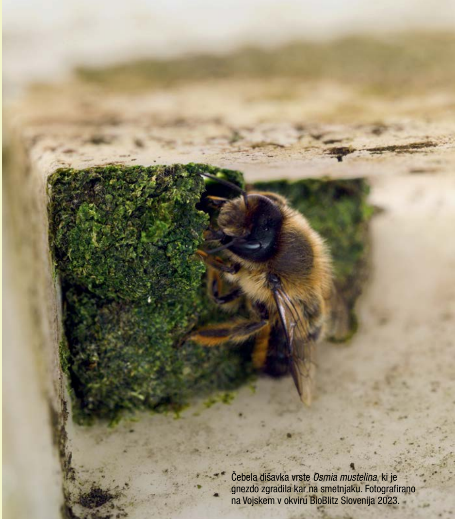
Čebela dišavka vrste Osmia mustelina , ki je gnezdo zgradila kar na smetnjaku. Fotografirano na Vojskem v okviru BioBlitz Slovenija 2023.

Sodelovali smo na dogodku BioBlitz Slovenija, ki je potekal 16. in 17. junija na Vojskem. Namen dogodka, ki vsako leto poteka drugje, je v 24 urah popisati biotsko raznovrstnost določenega območja. Sodelovale so kar 103 osebe iz 34 organizacij. Čmrljica je sodelovala pri popisu čebel. V kratkem popisu smo na cvetočih travnikih našli 18 vrst čebel, od tega pet vrst čmrljev. Našli smo tudi dišavko vrste Osmia mustelina , ki je gnezdo zgradila kar na smetnjaku. Izvedli smo tudi monitoring divjih čebel na pozno košenem travniku v ljubljanskem parku Tivoli.